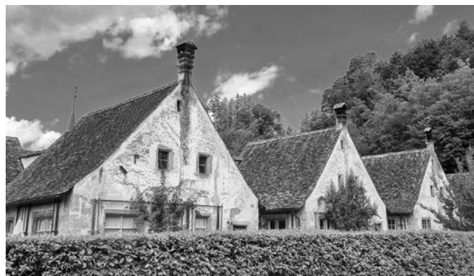
Kartause Ittingen in Warth-Weiningen.

Die Reise ging weiter zum Weingut Jäger in Hüttwilen, wo wir herzlich empfangen wurden und Gelegenheit hatten, einige köstliche Weine der Region zu degustieren. Etwas müde und mit erlesenen Weinen im Gepäck machten wir uns auf den Weg zu unserem Übernachtungsort, dem schicken Hotel Seegarten in Arbon. Unsere Unterkunft war gemütlich und das Abendessen mindestens so reichhaltig wie das Mittagessen. Wer danach rechtzeitig zu einem Verdauungs-Spaziergang ans nahe gelegenen Bodenseeufer aufbrach, konnte bei angenehmer Temperatur einen traumhaft schönen Abend mit Sonnenuntergang geniessen. Die ganze Umgebung wurde dabei in ein magisches Glühen verwandelt. Ein Schlummertrunk im Restaurant-Garten bei Geplauder und Gelächter war der perfekte Abschluss unseres ersten Reisetages.