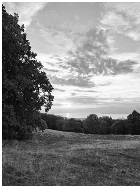
Wenn da nicht Ferienstimmung aufkommt...

Trotz des hügeligen und steilen Weges sind wir mit guter Stimmung auf „«La Barillette» hinaufgewandert. Einigen Schülern war dies noch nicht genug und sie marschierten schliesslich noch zu einem höheren Aussichtspunkt hinauf. Später assen wir gemeinsam ein leckeres Abendessen und liessen den Abend ausklingen.