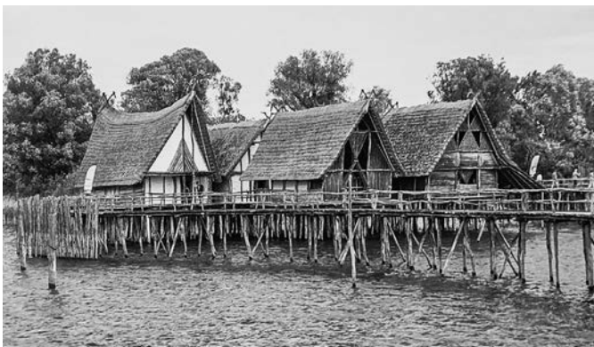
Pfahlbauten in Unteruhldingen, DE.