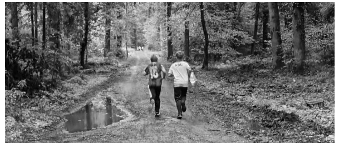
Das Wetter konnte den Läuferinnen und Läufer nicht trotzen.

Aufgrund Bauarbeiten in der Mehrzweckhalle in Utzenstorf konnten die Schülerinnen und Schüler diese nicht benutzen, daher beschlossen die Lehrpersonen der 5.-9. Klassen wieder das Thema des Orientierungslaufes aufzunehmen und dies mit einem Wettkampf vor den Herbstferien abzuschliessen. Der Schul-OL des Gotthelfschulhauses in Utzenstorf war dann auch ein voller Erfolg! In diesem sportlichen Event, der sich an die Schülerinnen und Schüler der 5. bis 9. Klasse richtete, herrschte eine fantastische Stimmung. Die Begeisterung und Motivation der Teilnehmerinnen und Teilnehmer waren förmlich spürbar und trieben die gesamte Veranstaltung voran. Die Schülerinnen und Schüler haben mit grossem Eifer teilgenommen.