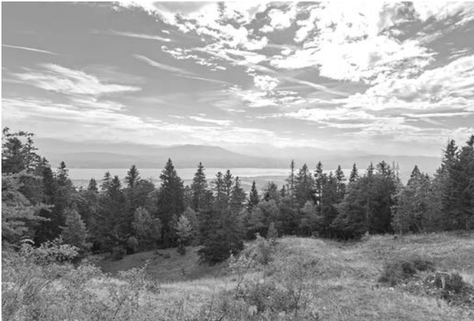
Eine traumhafte Woche mit einer traumhaften Aussicht.

Am Donnerstag, dem 14. September zogen wir los nach Nyon, bedauerlicherweise mit einer Person weniger, da sich diese am Fuss verletzt hatte. Mit dem Schiff fuhren wir über das glitzernde Wasser des Genfersees Richtung Yvoire. Ein kleines, schönes Städtchen mit köstlichem Gelato. Nach einem drolligen Abendessen genossen wir den letzten Abend in Saint-Cergue und mit guter Musik und toller Stimmung endete dieser!