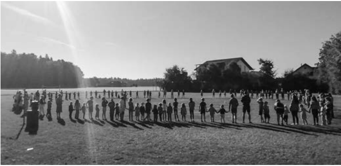
Die Begrüssung aller Kinder bei schönstem Wetter.

Als markantestes Ereignis dominierte die Pandemie seine Amtszeit, die das gesamte kirchliche Leben lähmte. Gern denkt er zurück an den gesprächsreichen Telefondienst und den Einkaufsdienst, der in dieser Notzeit mit Jugendli-