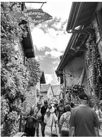
In einem solchen Dorf sprechen alle gerne französisch.

Am Donnerstag, dem 14. September zogen wir los nach Nyon, bedauerlicherweise mit einer Person weniger, da sich diese am Fuss verletzt hatte. Mit dem Schiff fuhren wir über das glitzernde Wasser des Genfersees Richtung Yvoire. Ein kleines, schönes Städtchen mit köstlichem Gelato. Nach einem drolligen Abendessen genossen wir den letzten Abend in Saint-Cergue und mit guter Musik und toller Stimmung endete dieser!