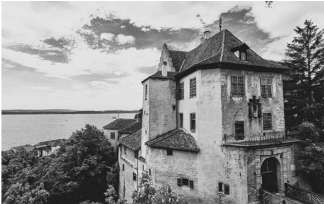
Burg Meersburg am Bodensee, DE