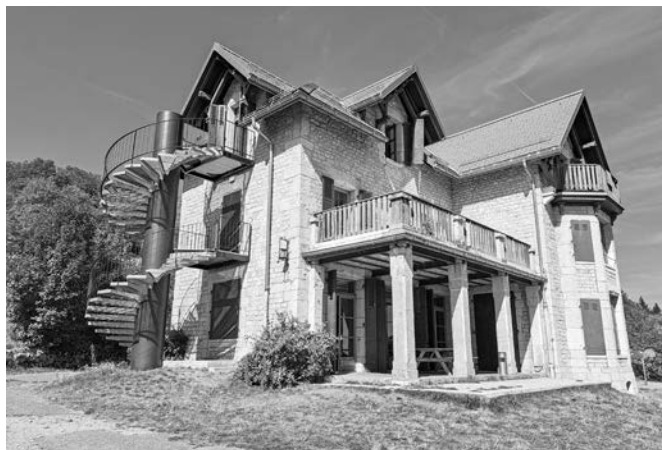
Eine Woche im Schloss, das erleben nicht alle.

In ständiger Begleitung von guter Musik, welche für gute Laune sorgte, watschelten wir den mühsamen Hügel hinauf. An diesem Tag hiess es ankommen, auspacken und chillen. Die folgenden fünf Tage verbrachten wir in einem alten Schloss, welches umgeben von idyllischem Kuhglocken-Läuten war und eine wundervolle Aussicht auf den Genfersee bot.