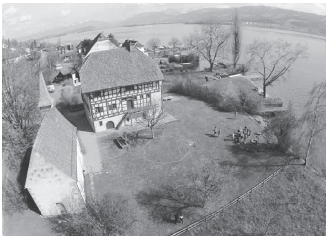
Das Ritterhaus mit viel Platz für Spiel und Spass.

Wie in jedem JAF-Jahr ist das Frühlingsferienprogramm eines der Highlights. Dieses Jahr können wir nur an drei Tagen ein Programm anbieten, da der Karfreitag uns in die Quere kommt. Gestartet wird am Montag mit einem Ausflug ins Aquabasilea in Pratteln BL. Am Mittwoch, 12. April gehen wir wie letztes Jahr in den BEO-Funpark in Bösing. Ein Car wird uns dorthin bringen und die Kinder & Jugendlichen können sich für einige Stunden im riesigen Park vergnügen. Ein Tag später organisieren wir einen Waldspielnachmittag im Geerenwald in Koppigen. Es wird fleissig nach einem Schatz gesucht, zusammen gelacht, gespielt und auch etwas Leckeres zu essen steht auf dem Programm. Alle weiteren Informationen und die Anmeldemöglichkeiten werden auf unserem Flyer stehen, der in einigen Wochen verteilt wird.