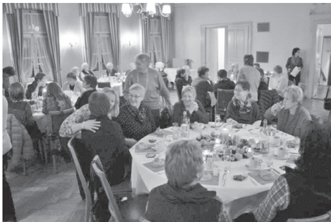
Eine grosse Schar Landfrauen an der Adventsfeier

Die Tische im grossen Saal des Landgasthof Bären waren festlich geschmückt mit Clemantinen, Äpfeln, Schokoladekugeln, Nüssen und Lebkuchen. Es duftete nach Tannengrün und Kerzen.