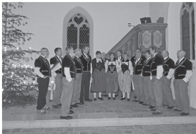
Auftritt in der Kirche Aetingen

Nach der Feier wurden wir im Restaurant Kreuz vorzüglich bewirtet und verpflegt. Bei Wein und Gesang sassen wir gemütlich beisammen.