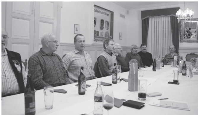
Singen an der HV gehört dazu

Der Vorstand wurde bestätigt und die Arbeit mit Applaus verdankt. Es ist erfreulich, dass alle Mitglieder, Ehemalige aber auch die Projektsänger am gleichen Strick ziehen und einander helfen. So chunnts guet und macht Freud!