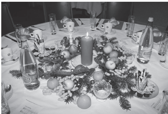
Weihnachtliche Tischdekoration im Gasthof Bären

Adventsfeier vom 8. Dezember 2016 im Landgasthof Bären Utzenstorf