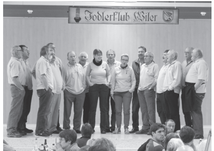
Ein paar Lieder helfen beim verdauen.

Am 28. Januar 2017 stand das traditionelle Hammeässe in der Aula Wiler auf dem Tätigkeitsprogramm. Wir wurden von einer überwältigend grossen Anzahl Gäste besucht und konnten bis am Abend alle Hammebeine, Würste und Torten unter die Leute bringen. Beim Kartoffelsalat zeichnete sich kurzfristig nach 40kg ein Engpass ab, der konnte dank schnellem Reagieren einiger Mitglieder abgewendet werden und die nachproduzierten 10kg fanden auch noch den Weg in die hungrigen Mägen. Danke nochmals allen Gästen und Helfern für diesen tollen Tag.